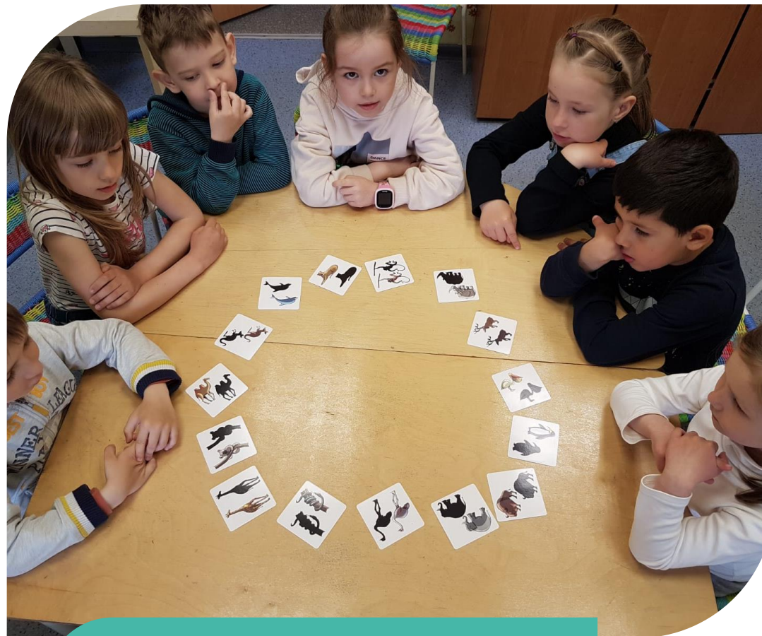
Раннее развитие «Фанатики- бантики»