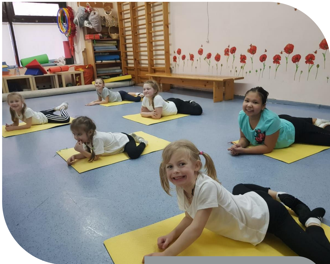
Секция ОФП для малышей