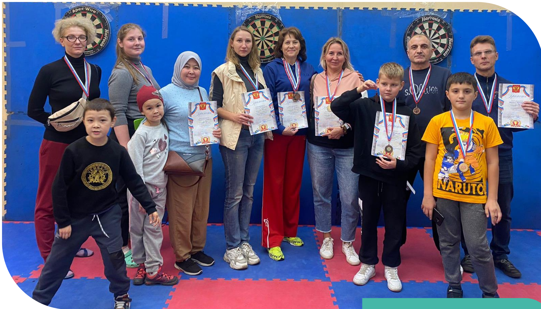
Соревнования по дартс