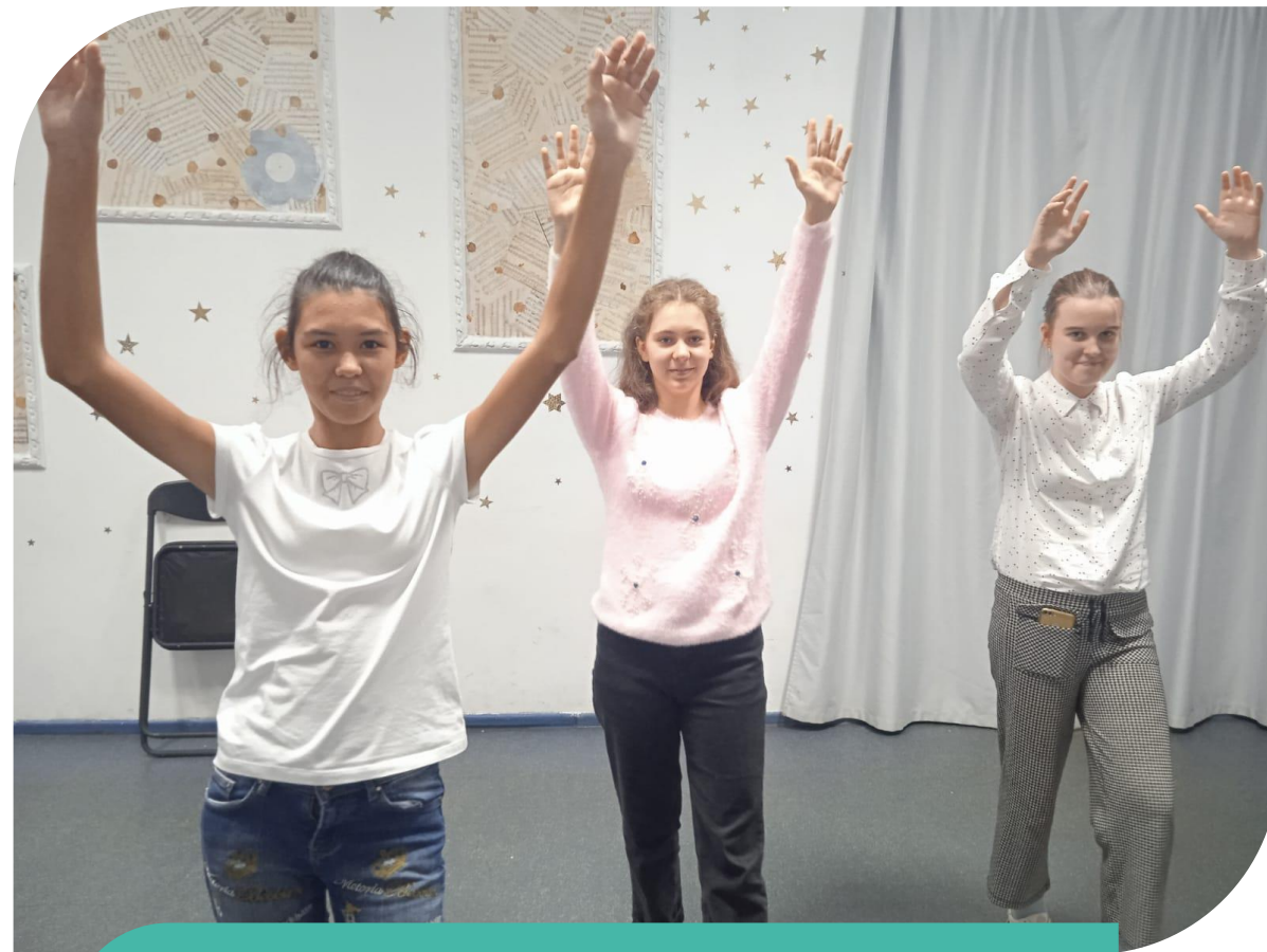
Спортивная секция ОФП с элементами растяжки