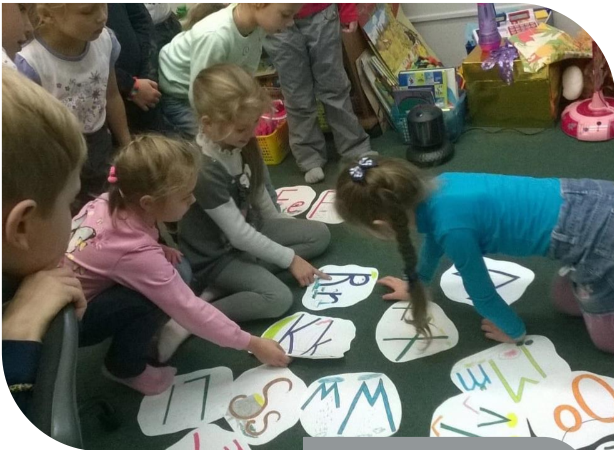
Английский язык «Peter Pan»