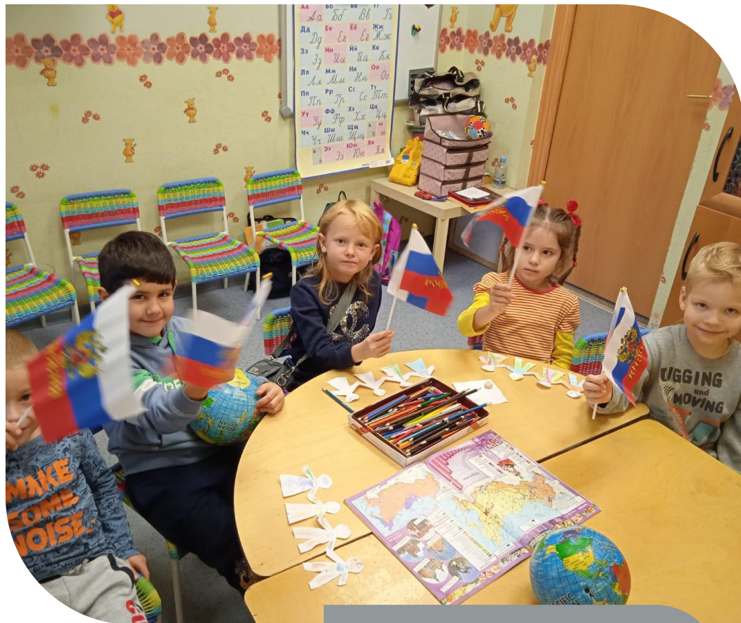
Раннее развитие «Умники»