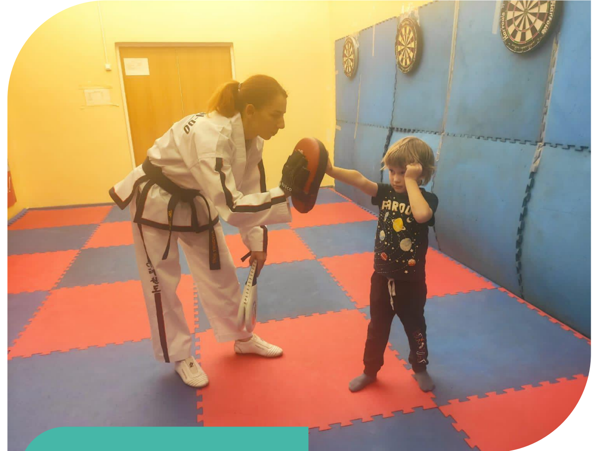
Мастер класс по тхэквондо