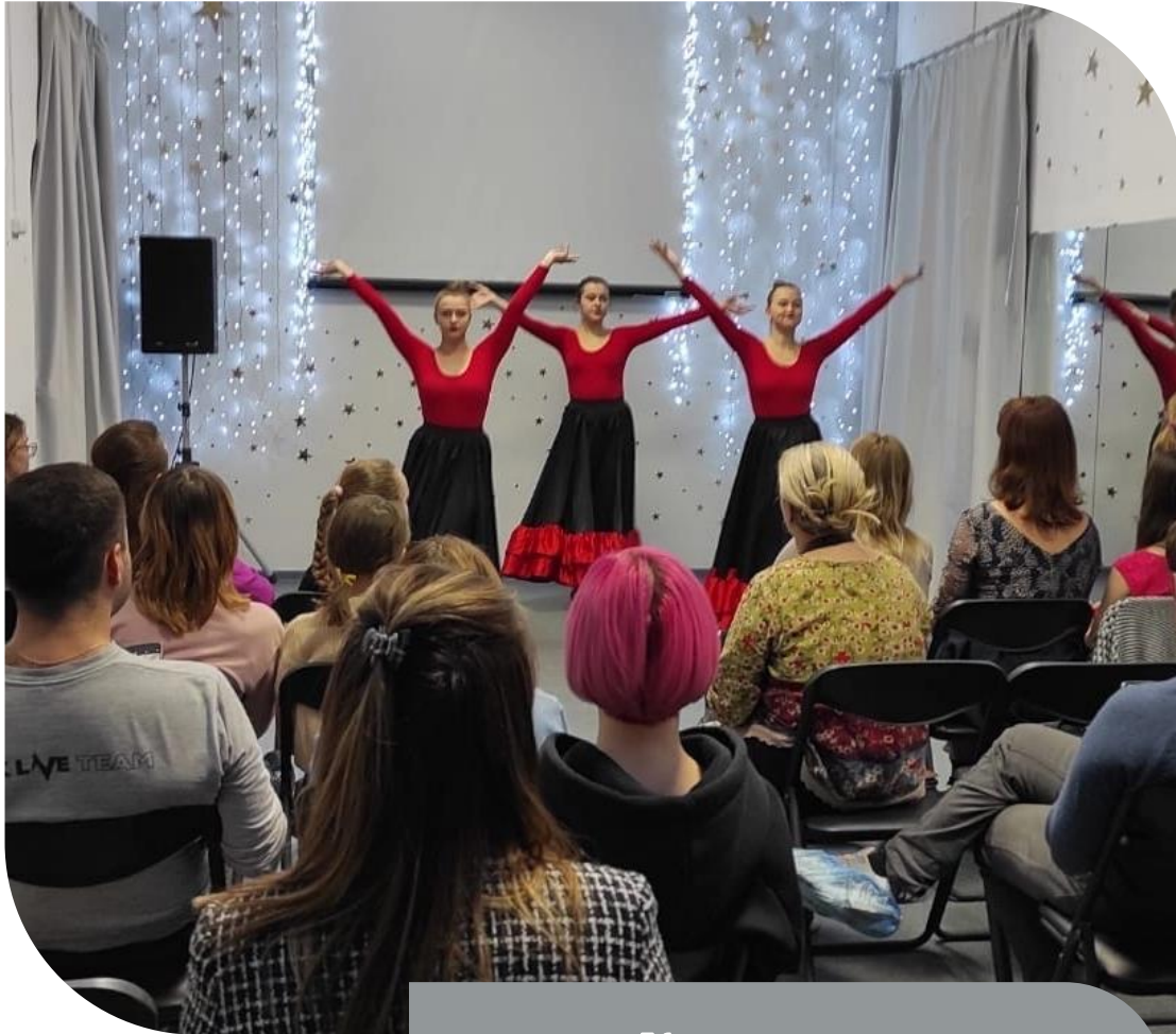
Концерт, посвященный Дню Матери