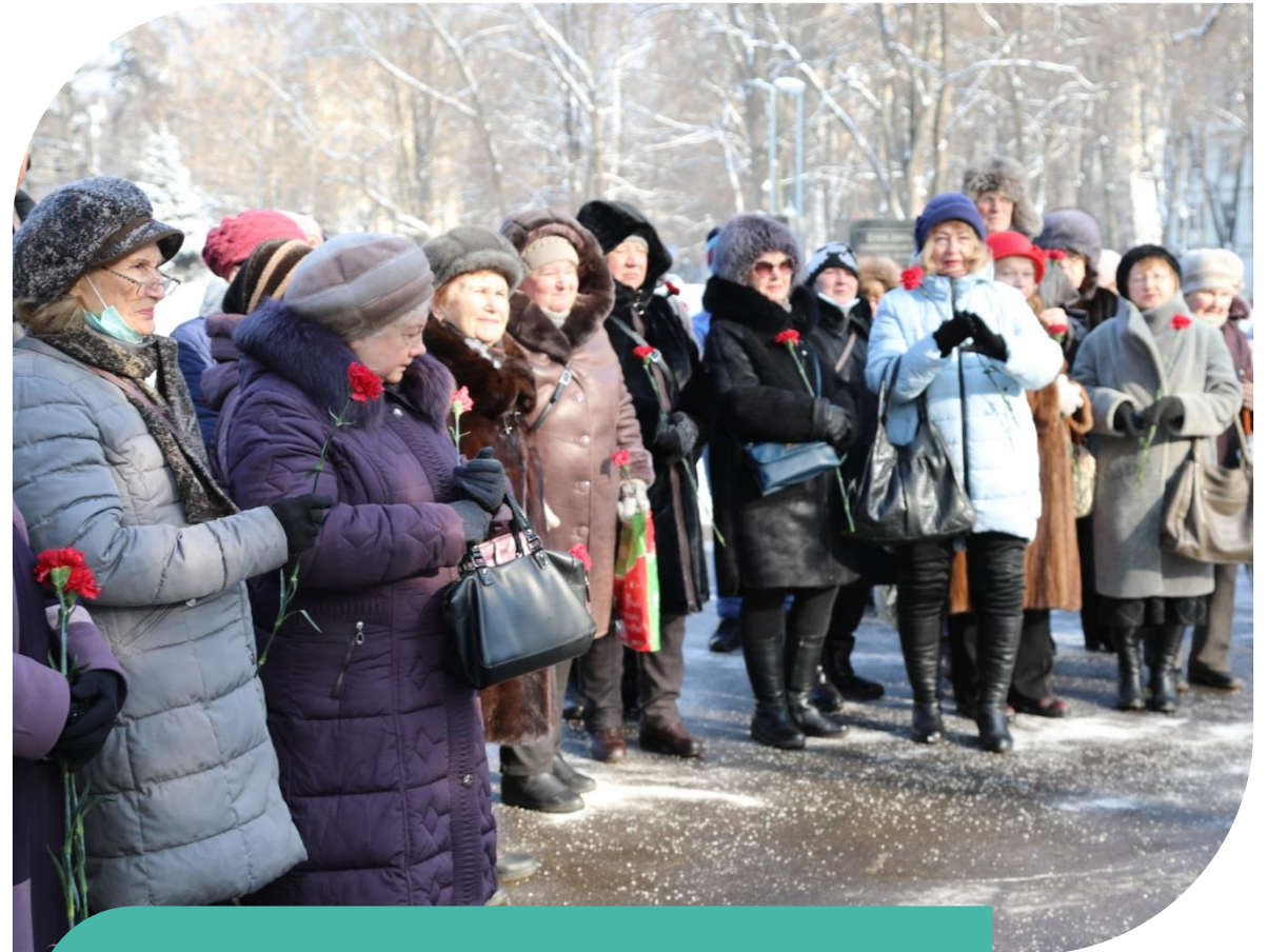
Патриотическое мероприятие «Мужество, отвага, честь.»