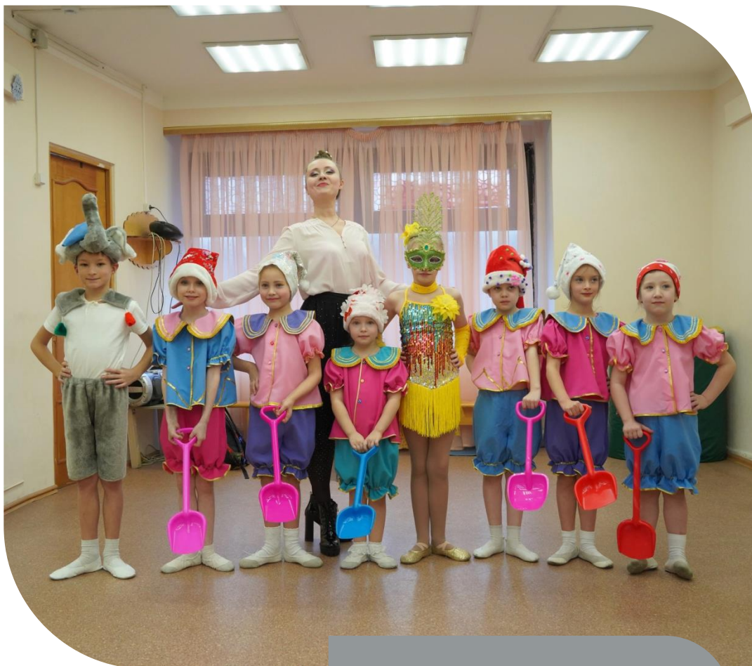
Театр моды грация