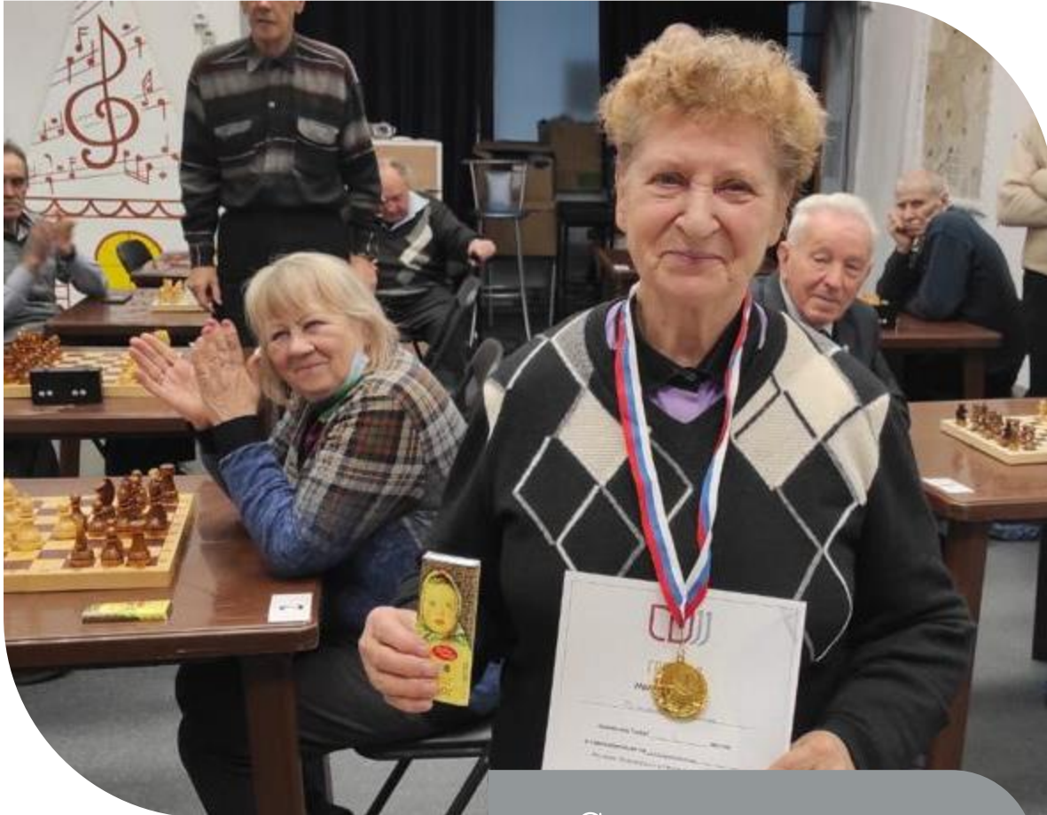
Соревнования по шахматам